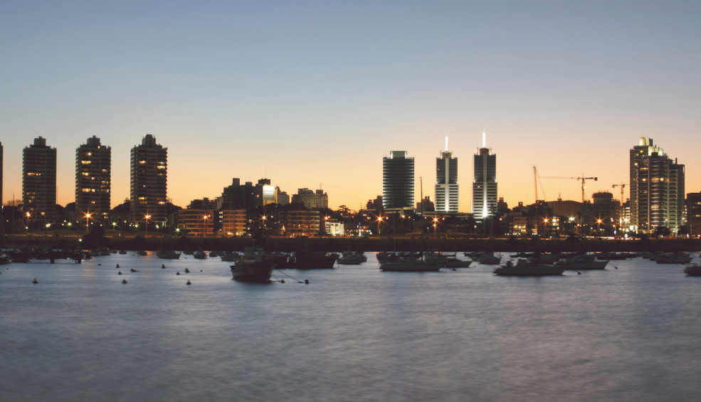
Vista de la costa uruguaya.

parten con ese destino de tranquilidad humana, preciosos silencios y cordialidad inmensa. La historia espera a quien visita esta ciudad que habla a quien la quiere escuchar, desde sus casitas coloniales a los adoquines 1 del empedrado típico de las calles.