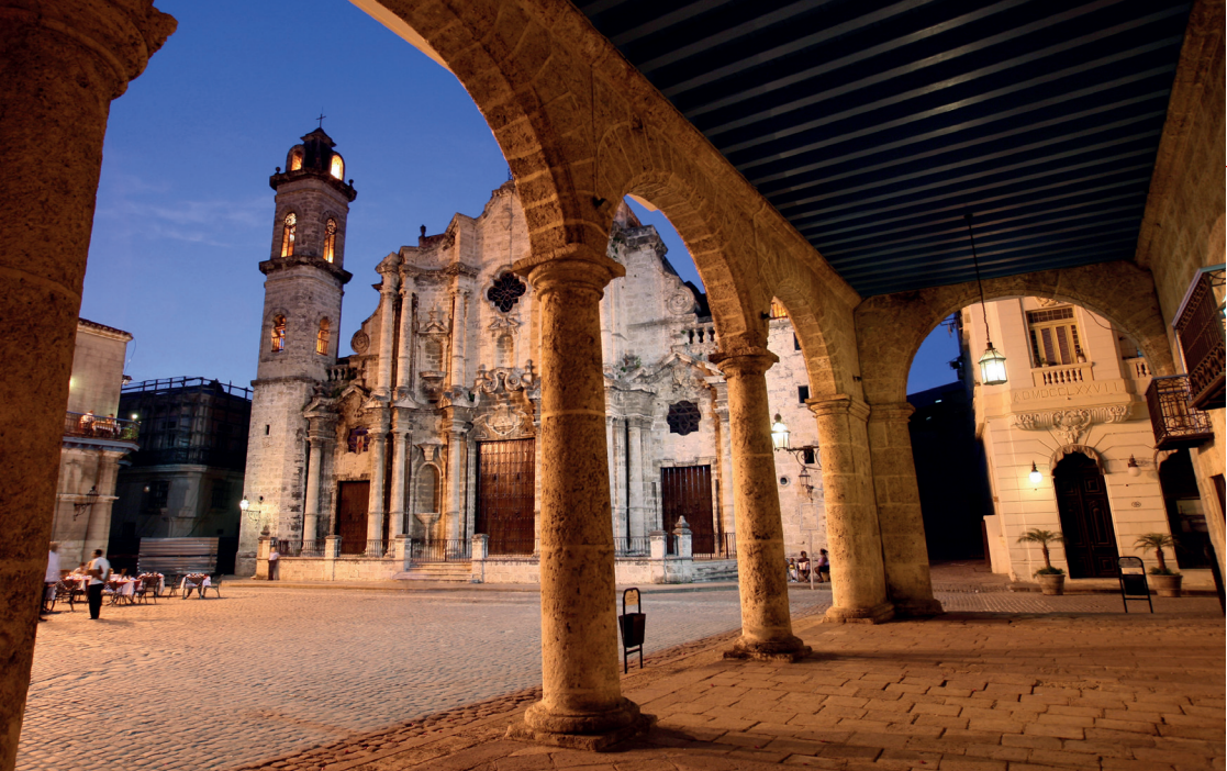
Plaza de la Catedral, La Habana