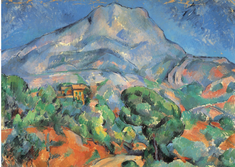
La Montagne Sainte-Victoire , Paul Cézanne, 1896-98. Musée de l'Ermitage, Saint-Pétersbourg.