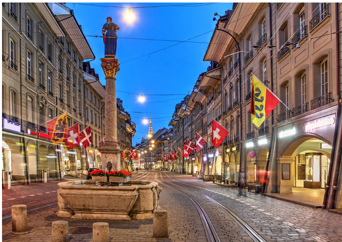
BERNA È LA CAPITALE DELLA