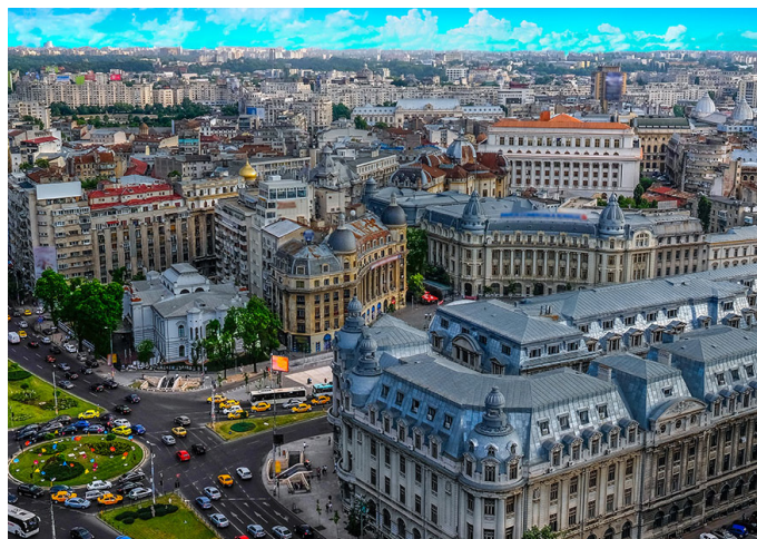
BUCAREST È LA CAPITALE DELLA

PER RAGGIUNGERE BUCAREST DA BERLINO QUALI STATI SI ATTRAVERSANO?