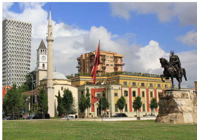
TIRANA È LA CAPITALE DELL'

PER RAGGIUNGERE TIRANA DA VARSAVIA QUALI STATI SI ATTRAVERSANO?