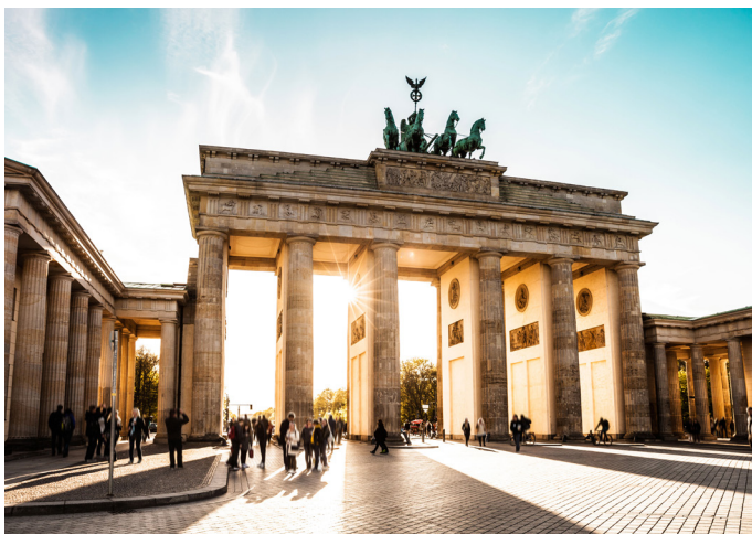
BERLINO È LA CAPITALE DELLA