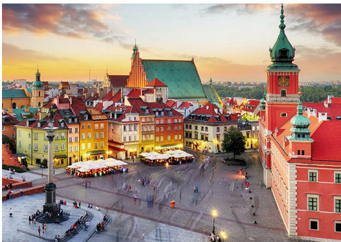
VARSAVIA È LA CAPITALE DELLA