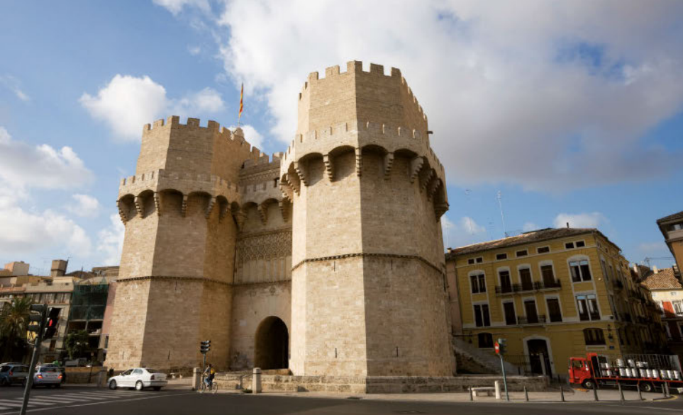
Puerta de Serranos.

Las posteriores invasiones bárbaras rompieron con la romanización y facilitaron la ruralización, y la casi desaparición de las actividades comerciales.